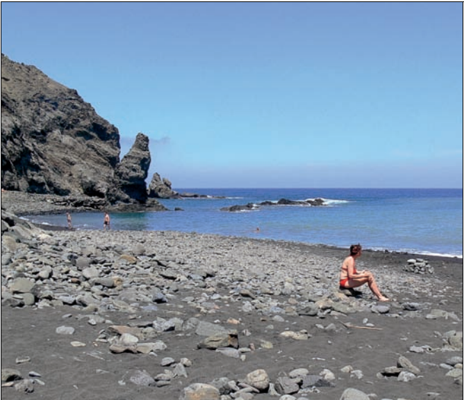
Playa de Caleta ▼