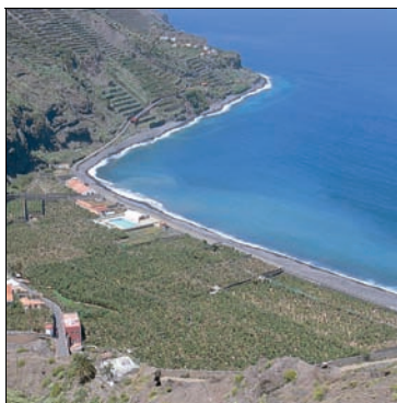
Blick auf die Playa Hermigua

Bananenplantage. Wir durchqueren die Plantage und verlassen den Barranco auf der anderen Seite ebenfalls über Treppen.