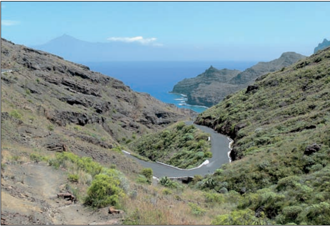
Die Straße hinunter zur Playa de Caleta

Serpentinen den Hang hinaufwandern. Allerdings ist man die ganze Zeit in schattenlosem Gelände unterwegs. Im Sommer, wenn sich der Teer aufheizt, kann das unangenehm werden.